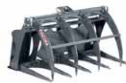
Greifgabel Skid Steer 1,15 m.