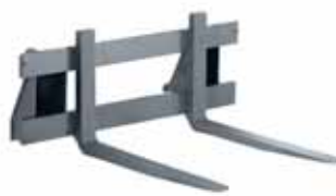
Palettengabel Skid Steer 1,20 m Zinkenlänge 0,80 m.