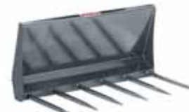
Dunggabel Skid Steer 1,21 m 6 Zinken/Zinkenlänge 0,56 m.