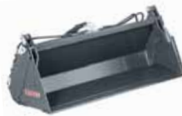
4-in-1 Universalschaufel mit Oberzange 1,40 m / 1,57 m.

Für die FC CompactLine Lader bietet STOLL ein spezielles Werkzeugprogramm an. Für die Lader FC 250 H/P, FC 350 H/P, FC 450 H/P und FC 550 H/P gibt es Werkzeuge für Skid Steer-Schnellwechselrahmen – für kurzen und kompakten Anbau. Für FC 250 L und FC 350 L gibt es Werkzeuge für das Pin-On-System d. h. mit Bolzenverbindung.