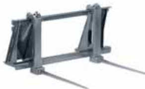
Ballenspieß Skid Steer 1,20 m Zinkenlänge 0,72 m.