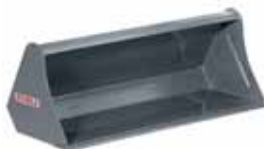
Schaufel Skid Steer 1,22 m / 1,40 m / 1,57 m / 1,74 m Pin-On-Bolzen 1,22 m / 1,40 m.